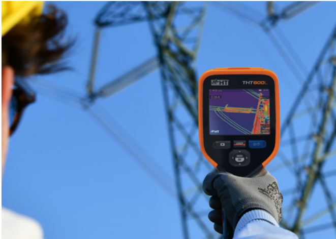
Hochspannungsisolator aufgenommen mit der THT600L