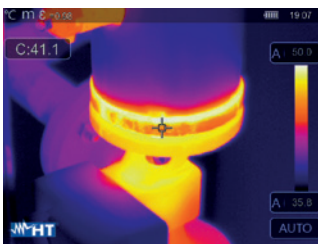
Vielseitige industrielle Anwendung